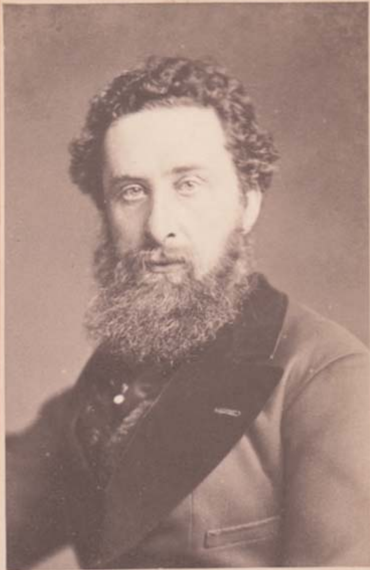
LORD LYTTON GOVERNOR GENERAL OF INDIA

nes de Europa y Oriente, muchas de ellas en forma oral. Barret tomó como base de sus prácticas las instrucciones y manuscritos del Abate Tritemio y Cornelio Agripa. Antes de morir formó un selecto grupo de discípulos o Aprendices de Magos en Londres, para estudiar, ampliar y preservar esta tradición. Entre ellos se encontraba Sir Edward Bulwer Lytton y un muy reducido número de discípulos -al día de hoy desconocidos. A la muerte de Barret, Bulwer Lytton continuó con la agrupación en Londres y a ésta agrupación se conectó el Abate Alphonse Louis Constant de Francia, mejor conocido como Eliphas Levi Zahed (1810-1875).