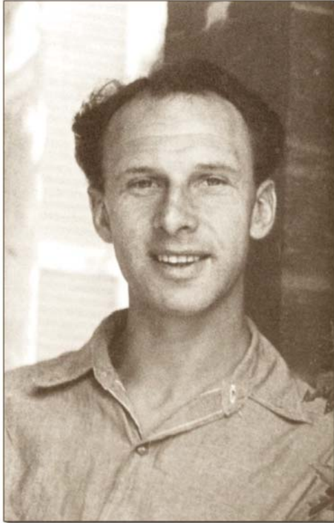
Rodney Collin a la edad de 39 años

Rodney Collin (Rodney Collin Smith) nació el 26 de Abril de 1909 en Brighton, en la costa sur de Inglaterra. Su padre fue un comerciante que se retiró de sus negocios en Londres a la edad de 50 años, como siempre había sido su intención. Después de efectuar un viaje al continente y a Egipto, se estableció en Brighton y contrajo matrimonio con Kathleen Logan, hija del dueño de un hotel. La pareja se estableció en una confortable casa en Brighton Front donde nació Rodney. Cuatro años después nació su hermano menor.